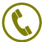
Telefone Fixo e Móvel

Possuímos um time de consultoras atenciosas e preparadas para auxiliar você apresentando as peças, na solicitação de pedidos e dando dicas sobre como melhorar suas vendas. Você poderá contar com sua Consultora de 2ª a 6ª feira, das 8h às 12h e das 13h às 18h, sempre que precisar, pelos canais: